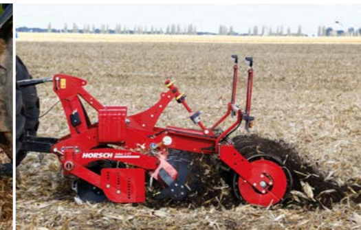
Maximaler Durchgang durch paarweise Scheibenanordnung