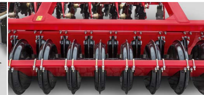
Doppel SteelDisc Packer für eine optimale Rückverfestigung auch auf schwersten Böden