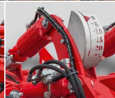
Optional Für Joker 5/6/8 RT hydraulische Arbeitstiefenverstellung