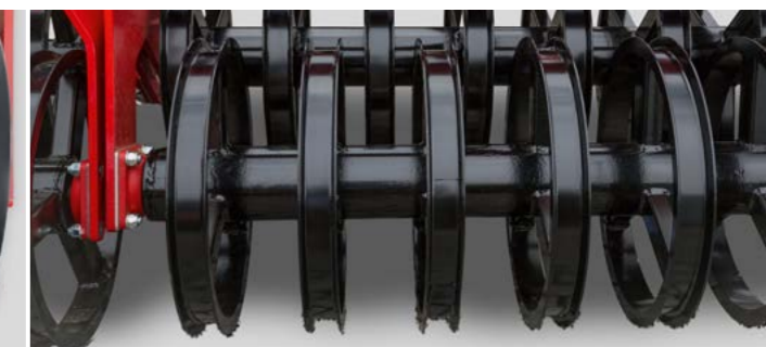
Doppel RollPack Packer für eine gute Krümelung und Rückverfestigung des Bodens