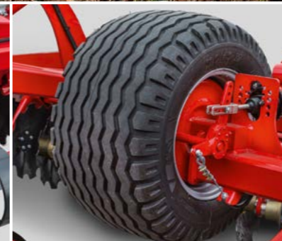
Transportfahrwerk Sicherer Straßentransport, optional Bremsanlage