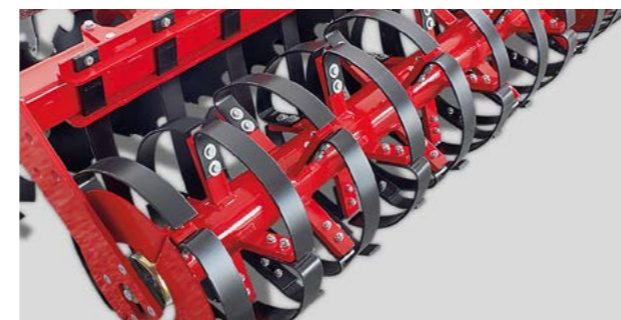
RollFlex Packer mit Packerelementen aus Federstahl