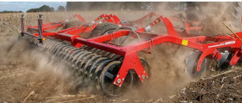
Die Joker hinterlässt einen feinkrümeligen, rückverfestigten Boden mit besten Auflaufbedingungen