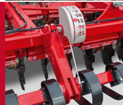
Crossbar Hydraulische Tiefenverstellung für perfektes Arbeitsergebnis

Das neue Vorwerkzeug ist perfekt für die Arbeit z. B. in Raps und Sonnenblumenstopplern geeignet.