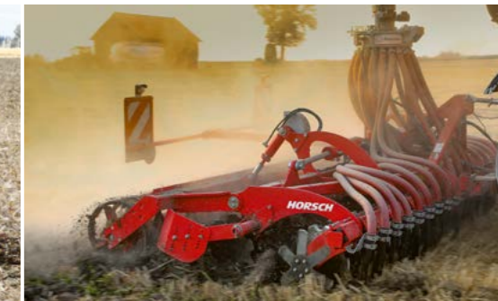
Joker CT bei der Gülleeinbringung