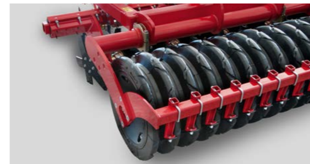
Der FarmFlex Packer verfügt über effektive und robuste Abstreifer für einen störungsfreien Lauf