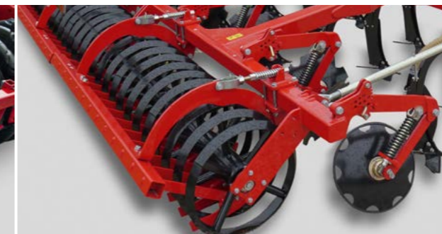
RollCut Packer gute Oberflächenstruktur auf mittelschweren, steinfreien Böden