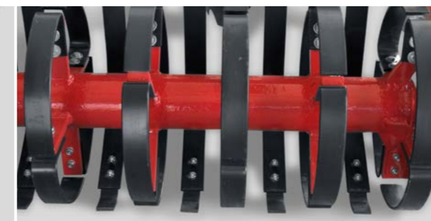
Blattfederelemente zwischen den Packerringen unterstützen die Einebnung der Bodenoberfläche