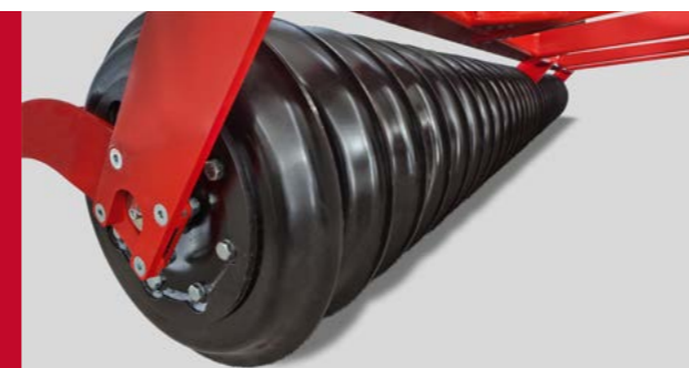
Geschlossener SteelDisc Packer mit schneidenden Packerringen