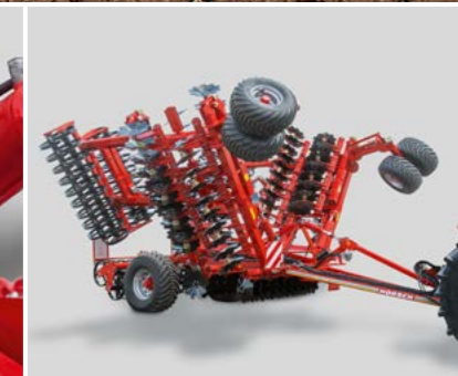
Joker 10/12 RT Kompakte Transportmaße: 3 m Transportbreite, 4 m Transporthöhe