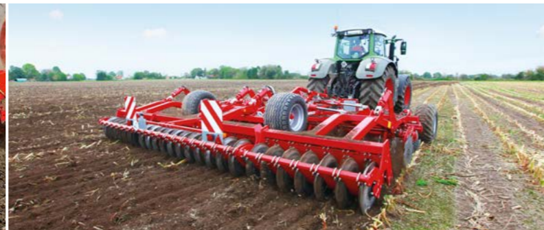
Effektive Packersysteme sorgen für eine intensive Krümelung und Rückverfestigung