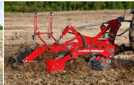
Robustes DiscSystem sichert optimale Mischqualität und Einebnung