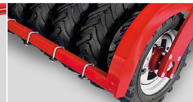
Walkfähiger Reifenpacker mit AS Profil